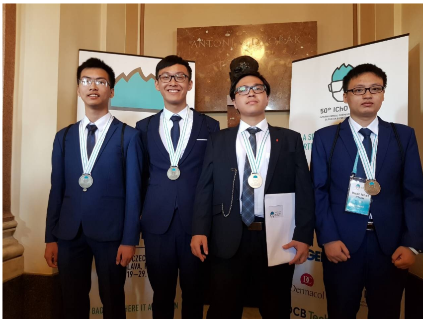
4 chàng trai c a đ i tuy n Vi t Nam đ thi Olympic Hóa h c qu c t năm 2018 đ u giành đ c huy c

C c Qu n lý ch t ng (B GD-ĐT) v a thông báo v k t qu c a đ i tuy n Vi t Nam đ thi Olympic Hóa h c qu c t năm 2018. C 4 thí sinh đ u giành đ c huy ch ng, trong đó có 1 huy ch ng Vàng.